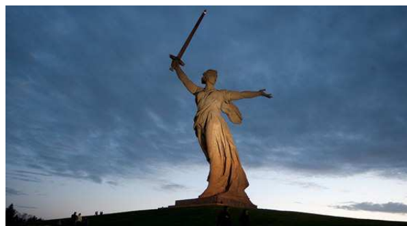
Matka vlast - Mamajevská mohyla