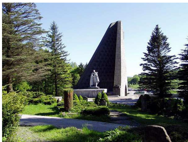
Památník na Dukle