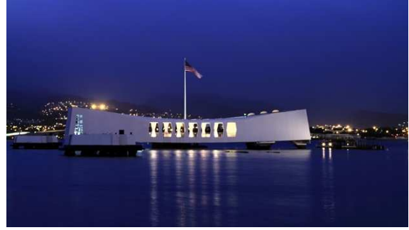
Památník USS Arizona – Pearl Harbour - Havaj