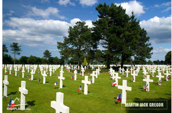
Vylodění v Normandii – pláž Omaha