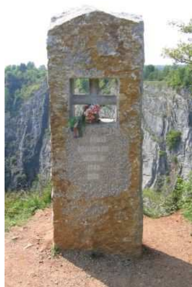
Lomy Amerika 1949 - 1953